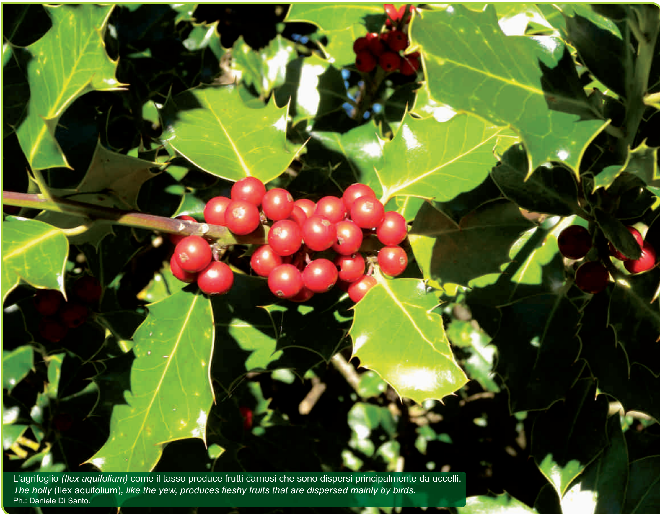
L'agrifoglio ( Ilex aquifolium ) come il tasso produce frutti carnosi che sono dispersi principalmente da uccelli. The holly ( Ilex aquifolium ), like the yew, produces fleshy fruits that are dispersed mainly by birds.