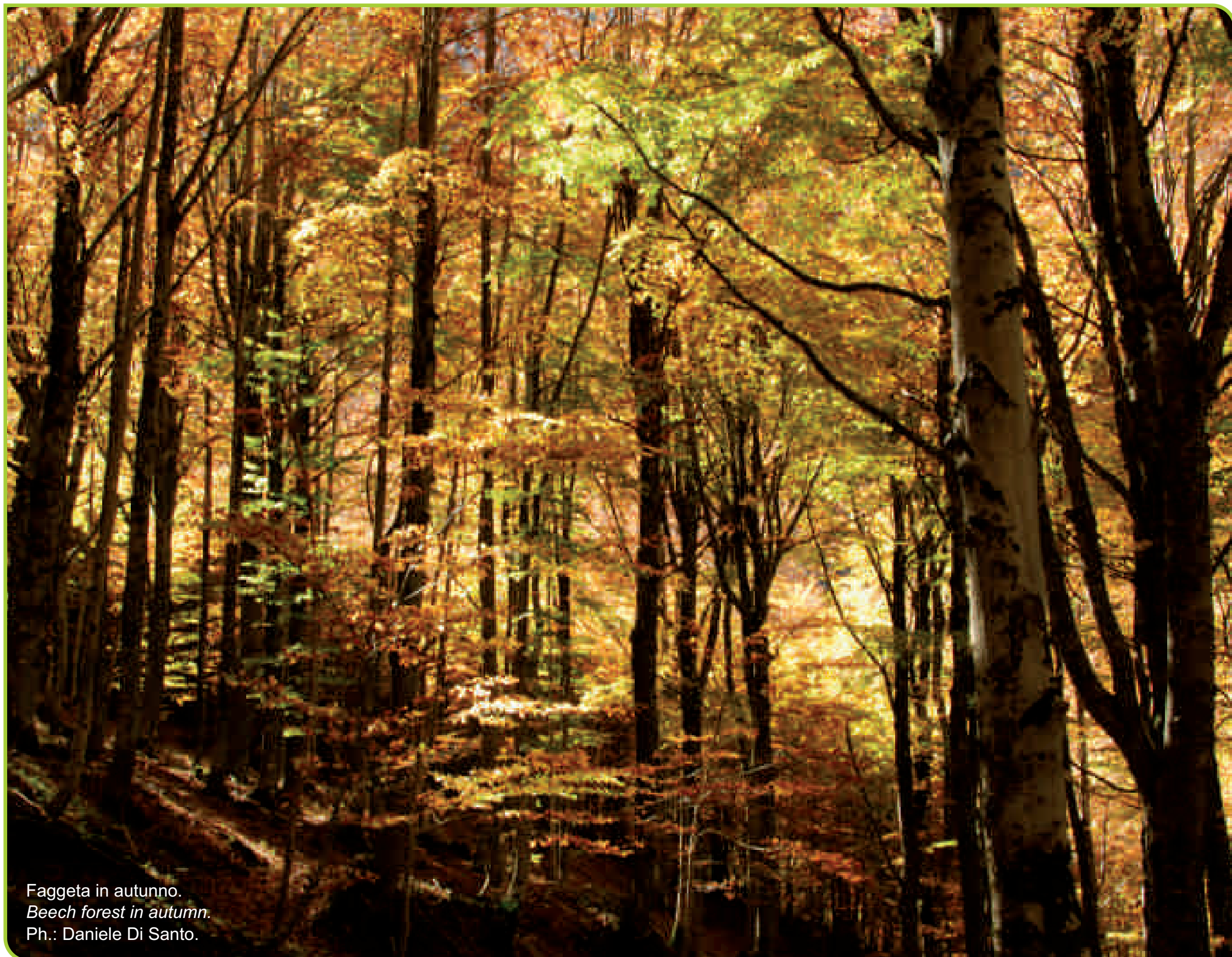
Faggeta in autunno. Beech forest in autumn.