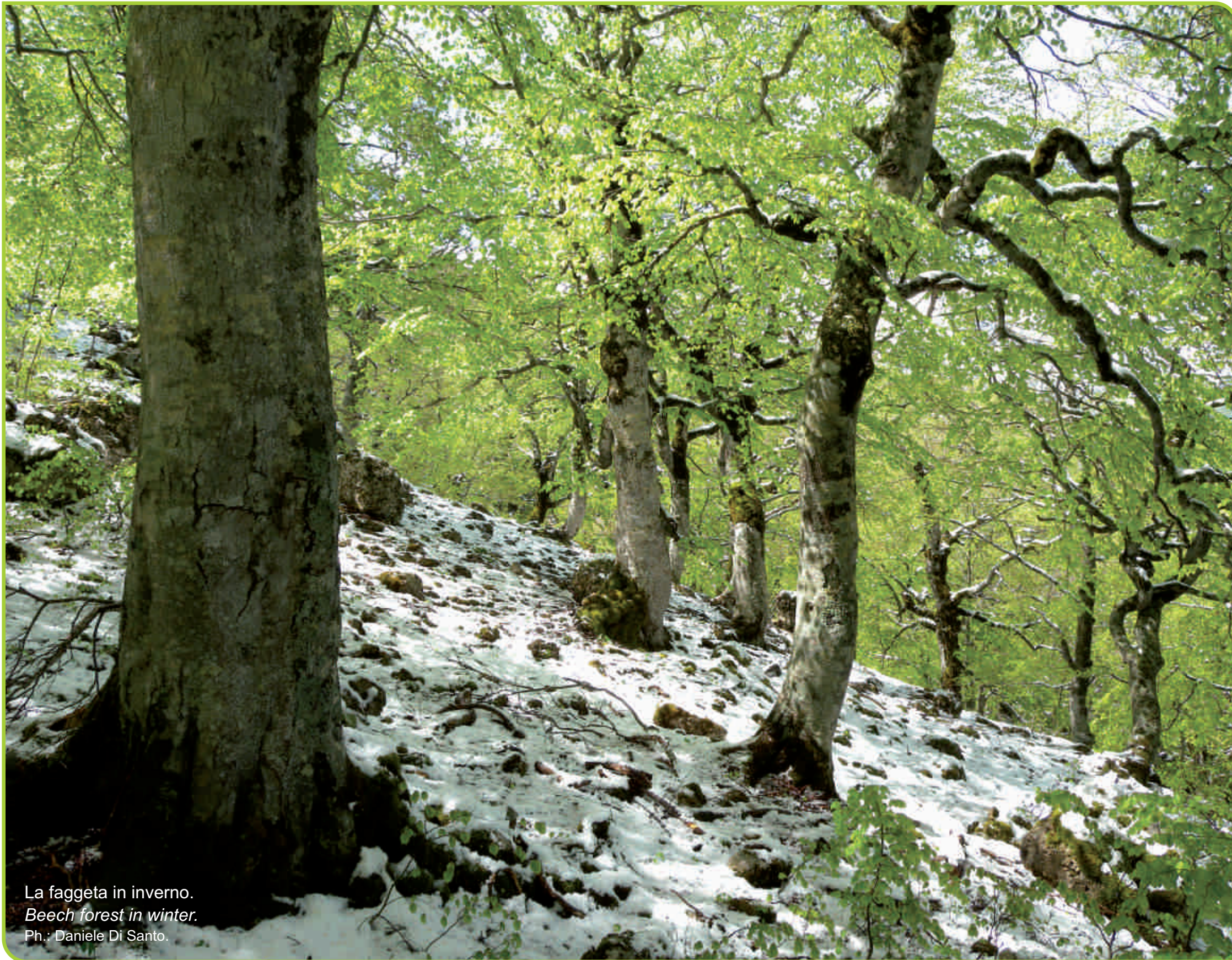
La faggeta in inverno. Beech forest in winter.