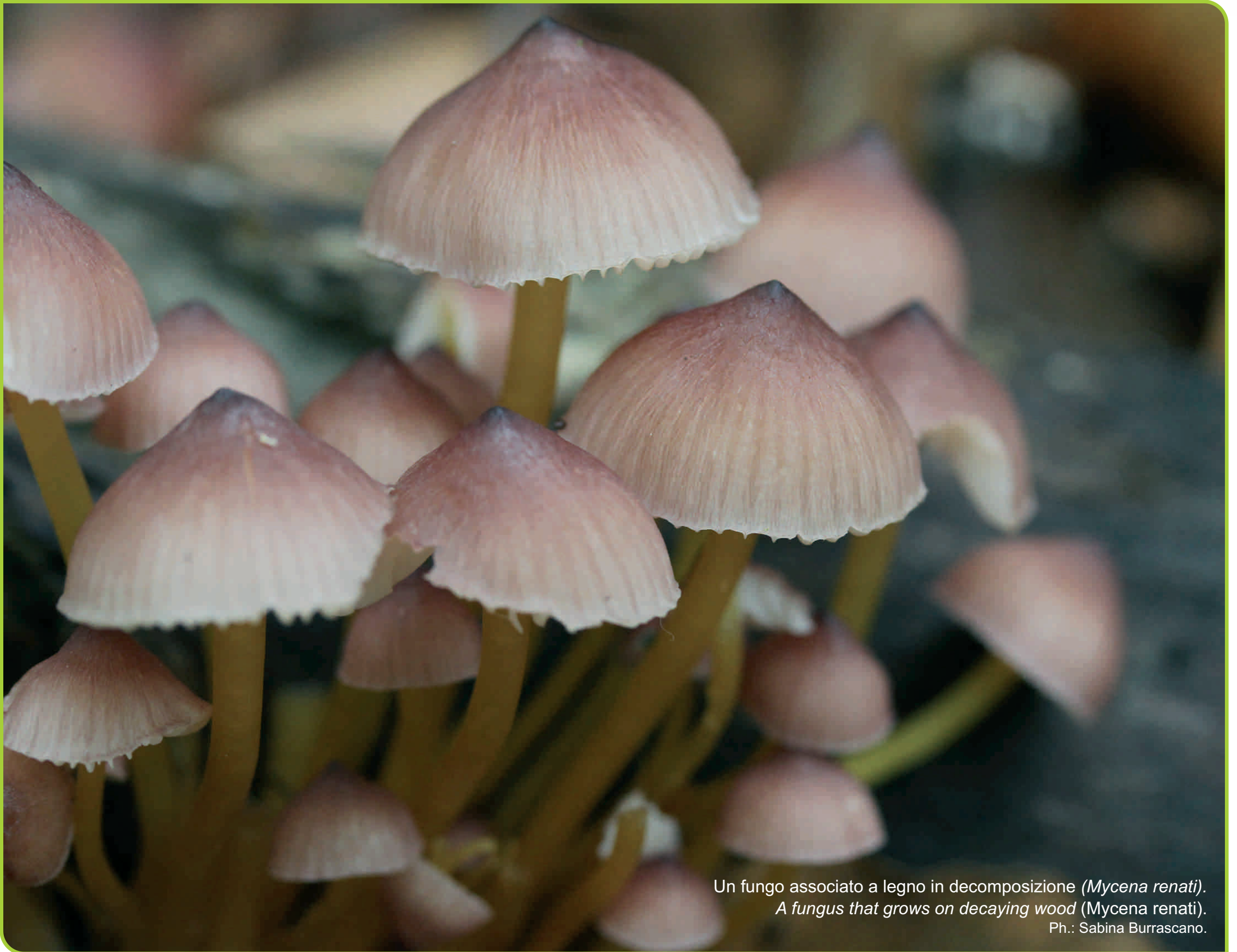
Un fungo associato a legno in decomposizione ( Mycena renati ). A fungus that grows on decaying wood ( Mycena renati ).