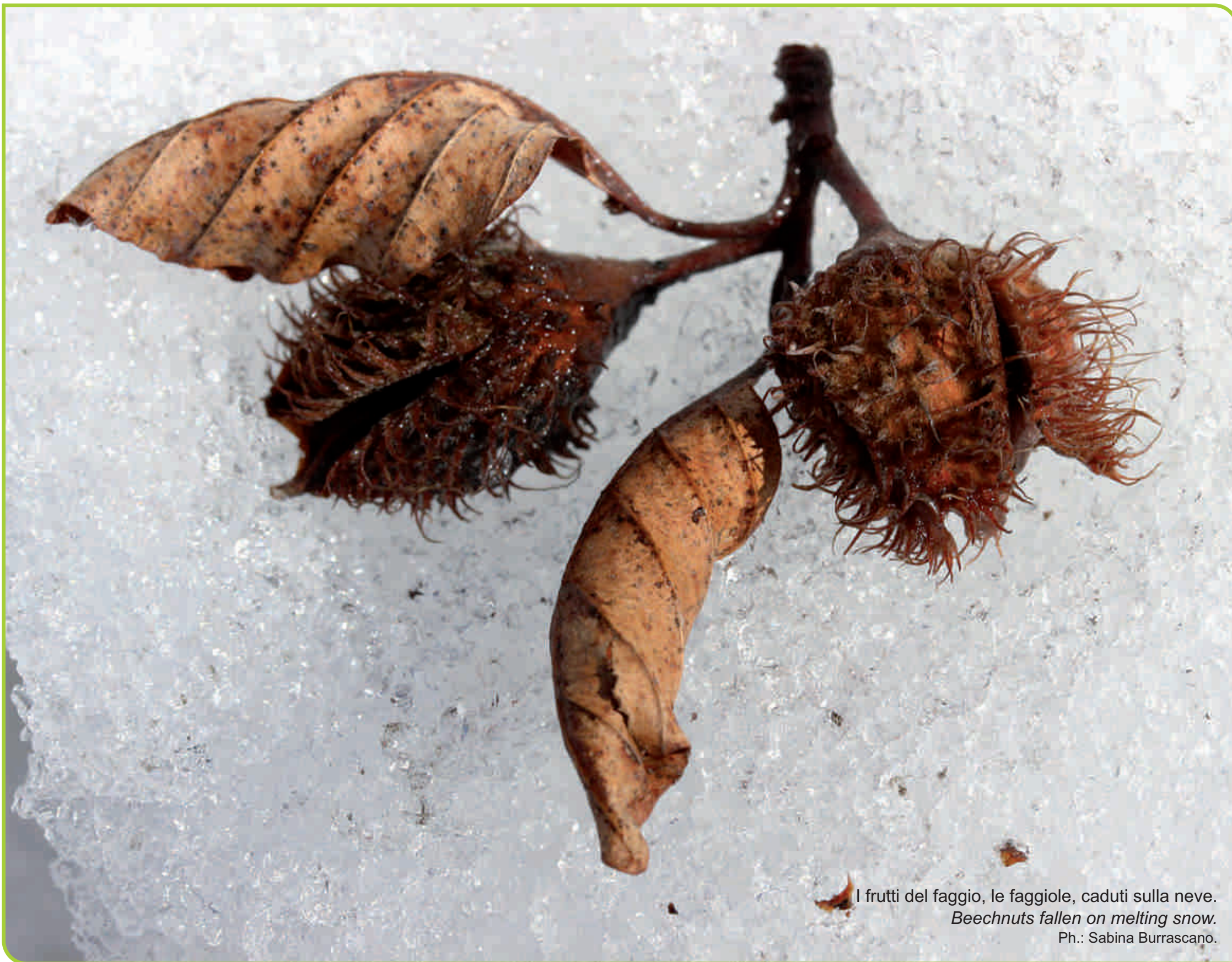
I frutti del faggio, le faggiole, caduti sulla neve. Beechnuts fallen on melting snow.