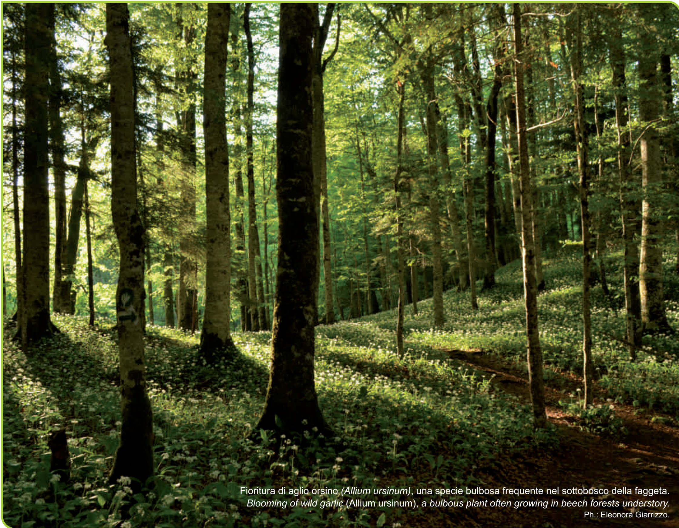
Fioritura di aglio orsino ( Allium ursinum ), una specie bulbosa frequente nel sottobosco della faggeta. Blooming of wild garlic ( Allium ursinum ), a bulbous plant often growing in beech forests understory.