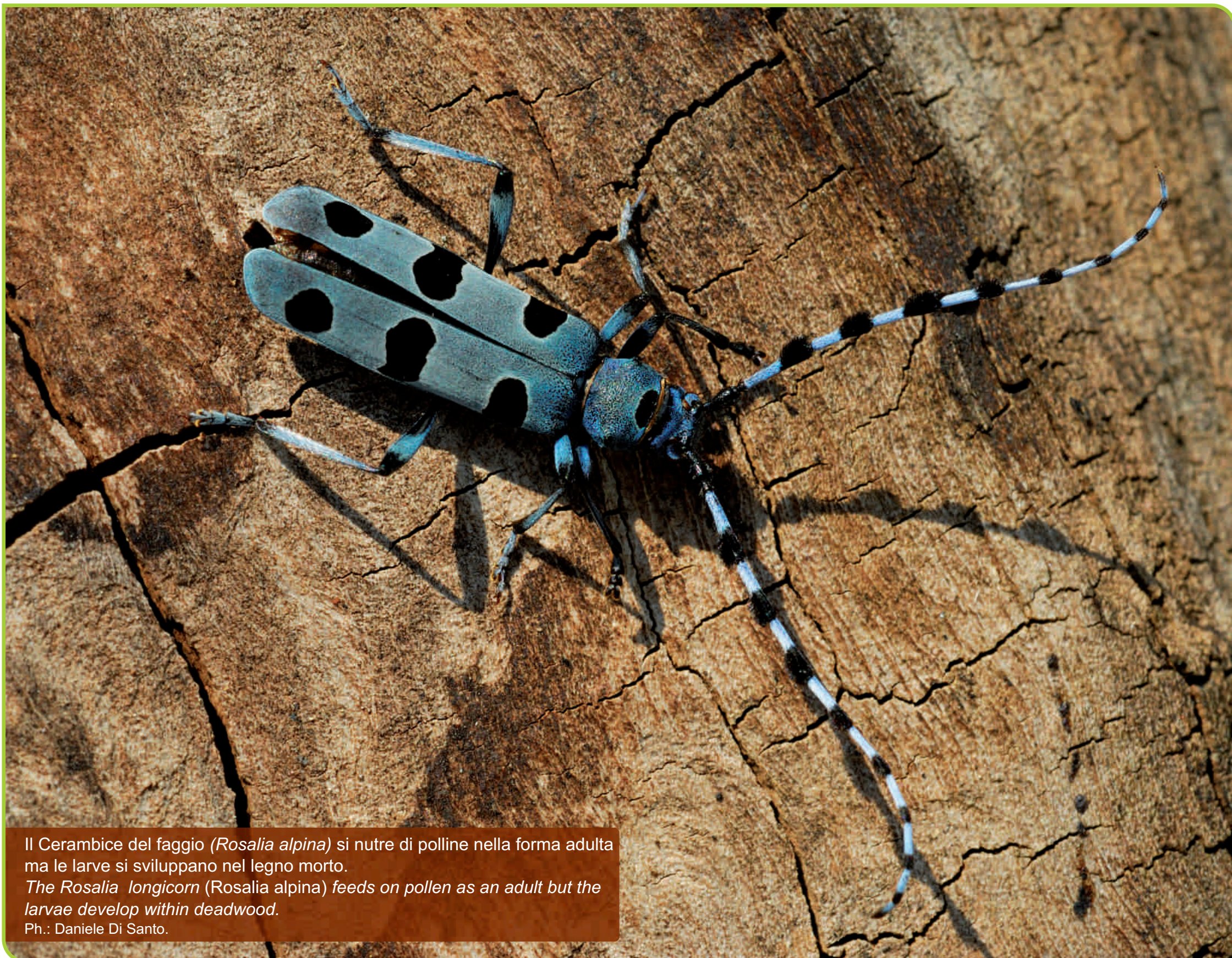
Il Cerambice del faggio ( Rosalia alpina ) si nutre di polline nella forma adulta ma le larve si sviluppano nel legno morto. The Rosalia longicorn ( Rosalia alpina ) feeds on pollen as an adult but the larvae develop within deadwood.