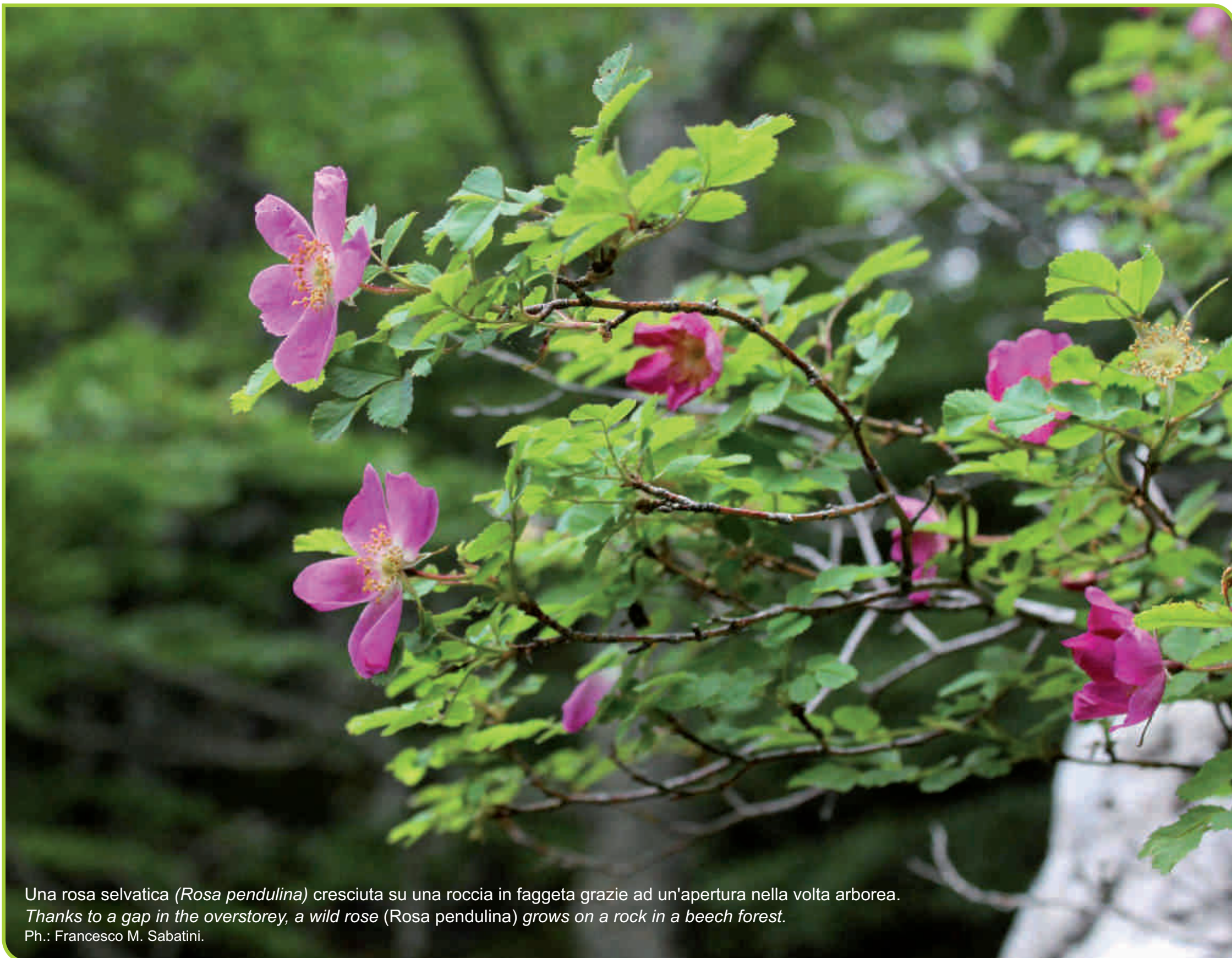
Una rosa selvatica ( Rosa pendulina ) cresciuta su una roccia in faggeta grazie ad un'apertura nella volta arborea. Thanks to a gap in the overstorey, a wild rose ( Rosa pendulina ) grows on a rock in a beech forest.