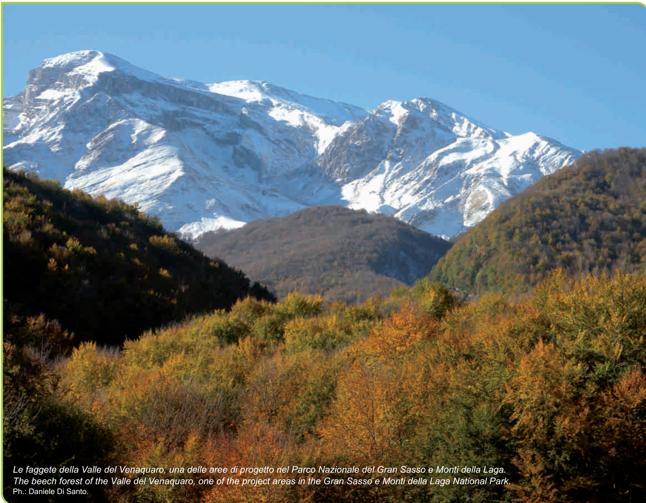
Le faggete della Valle del Venaquaro, una delle aree di progetto nel Parco Nazionale del Gran Sasso e Monti della Laga. The beech forest of the Valle del Venaquaro, one of the project areas in the Gran Sasso e Monti della Laga National Park.