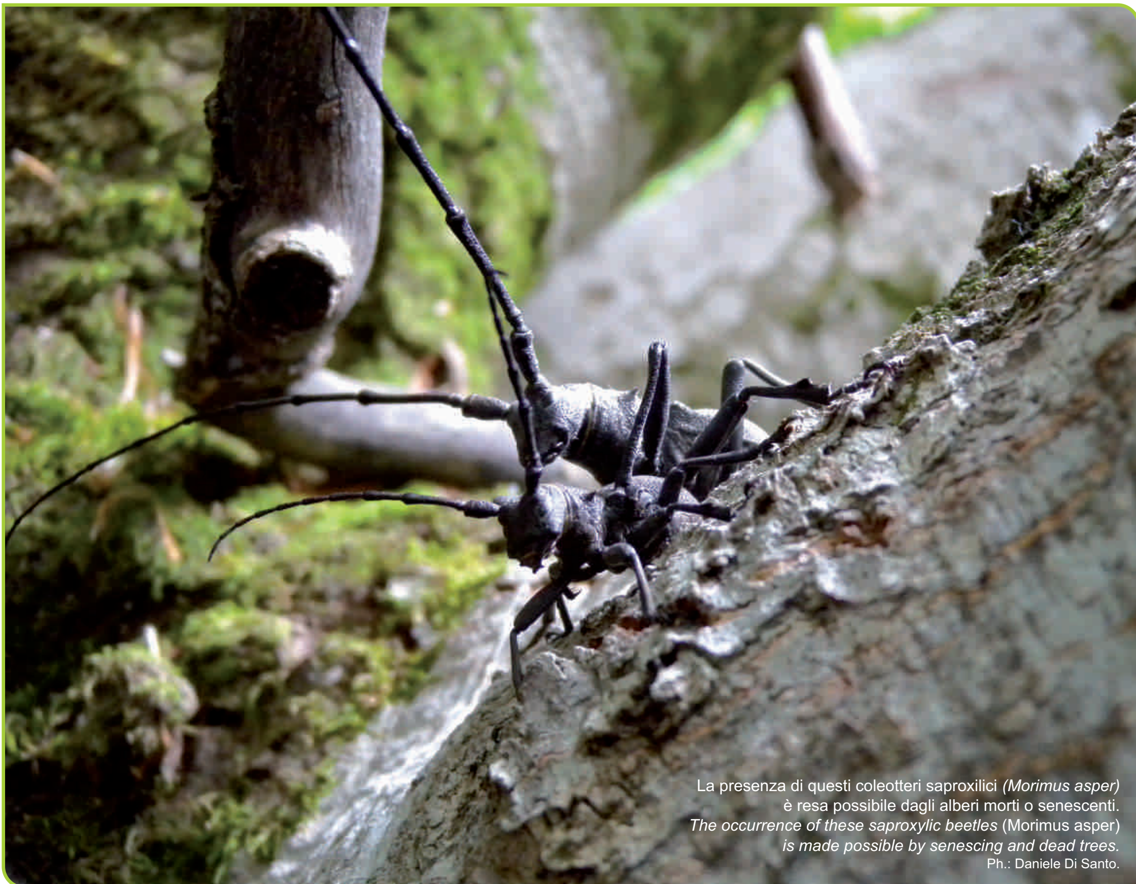
La presenza di questi coleotteri saproxilici ( Morimus asper ) è resa possibile dagli alberi morti o senescenti. The occurrence of these saproxilic beetles ( Morimus asper ) is made possible by senescing and dead trees.