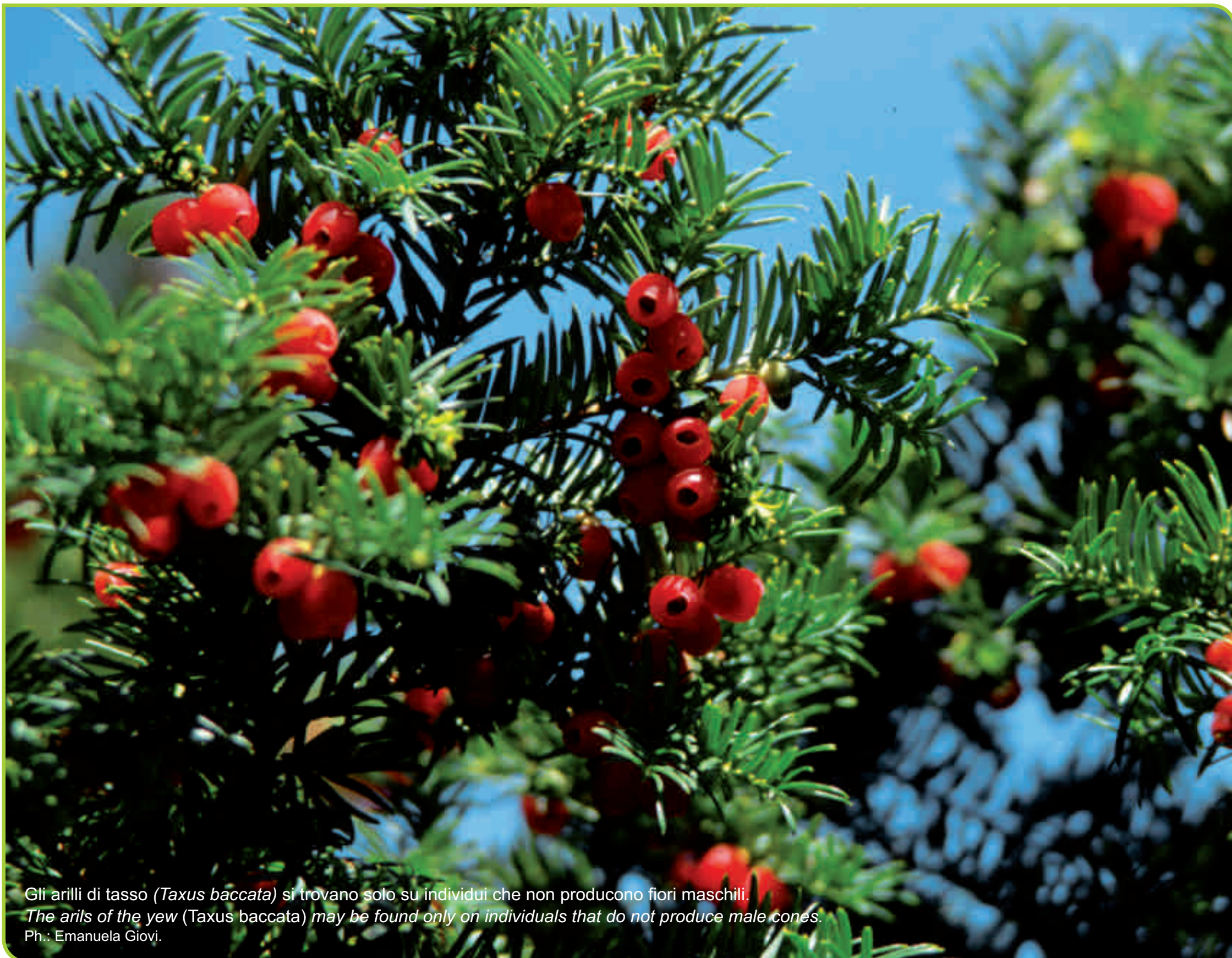
Gli arilli di tasso ( Taxus baccata ) si trovano solo su individui che non producono fiori maschili. The arils of the yew ( Taxus baccata ) may be found only on individuals that do not produce male cones.