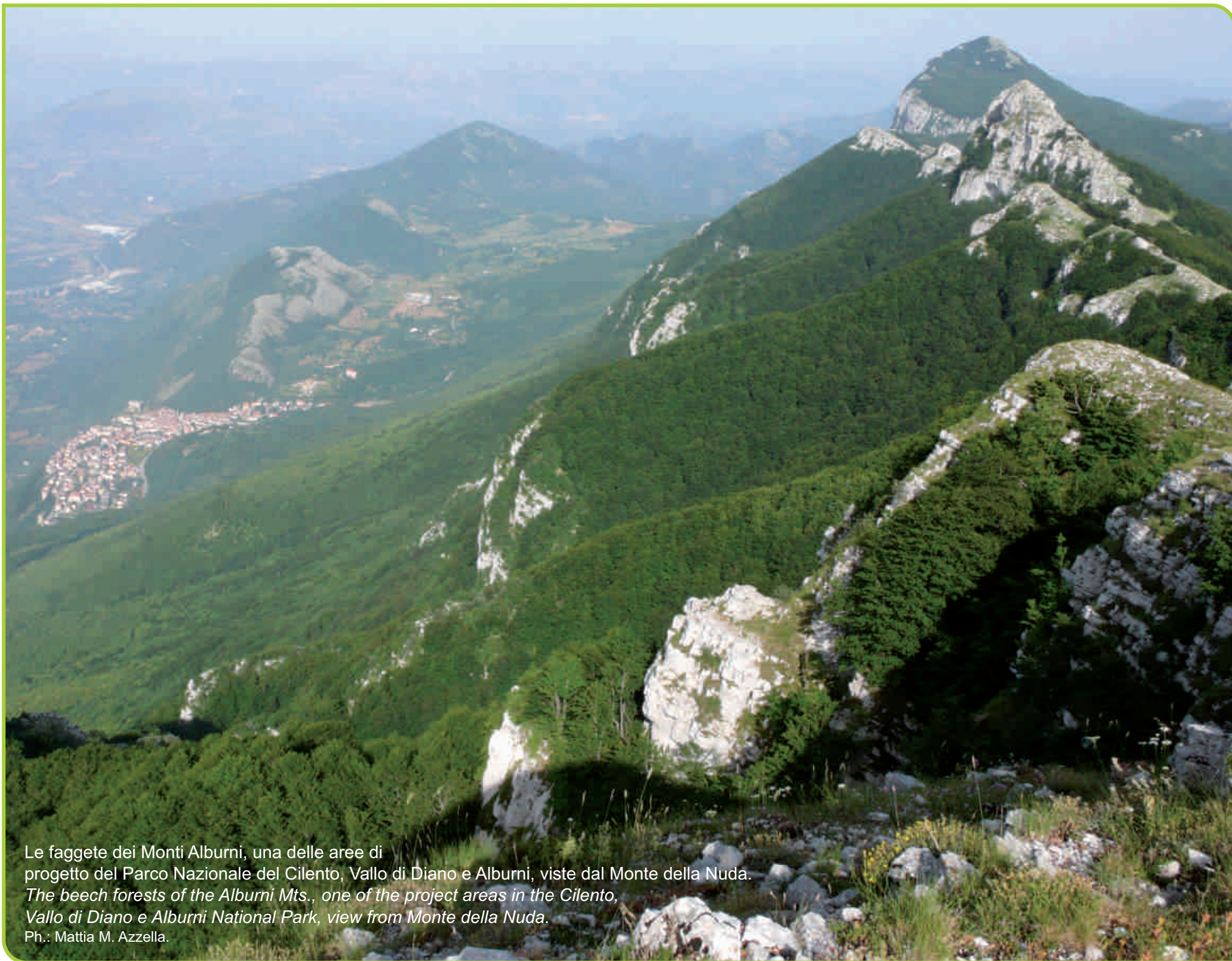
Le faggete dei Monti Alburni, una delle aree di progetto del Parco Nazionale del Cilento, Vallo di Diano e Alburni, viste dal Monte della Nuda. The beech forests of the Alburni Mts., one of the project areas in the Cilento, Vallo di Diano e Alburni National Park, view from Monte della Nuda.